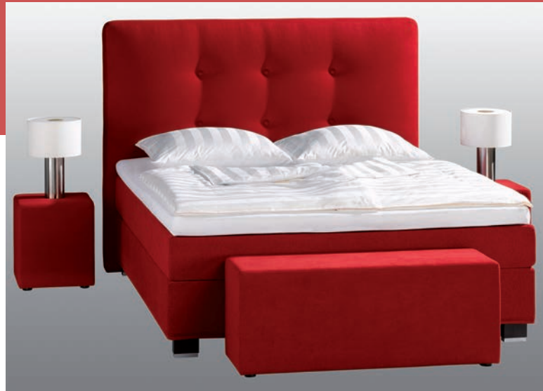
Abbildung: Box-Spring System: r///m Classic Line Wasserbett FüÙe: Blocks Kopfteil: Paris Höhe: 145 cm mit Knöpfen Zubehör: Deko Classic und Topper Royal 2 Sitzwürfel, Sitzbank ohne Stauraum