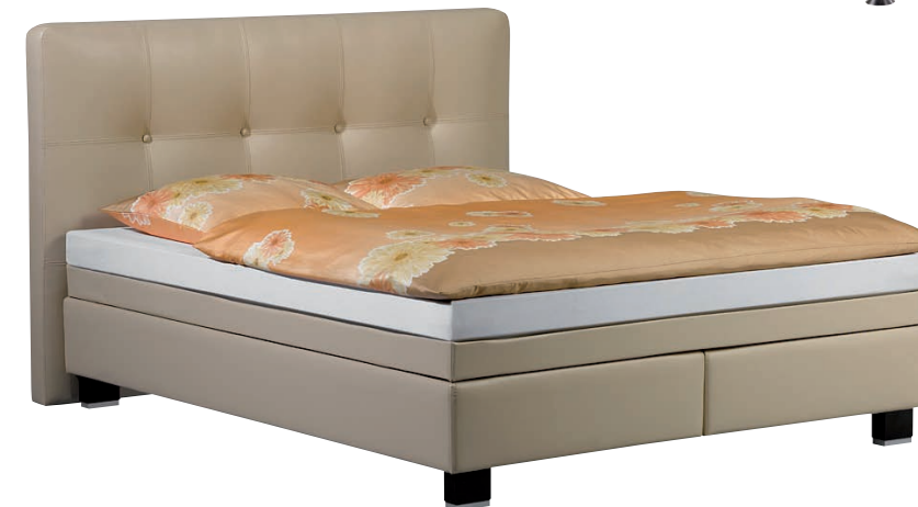
Abbildung: Box-Spring System: r///m Modern Line Wasserbett mit Dekoumrandung Füße: Blocks Kopfteil: Paris Höhe: 145 cm mit Knöpfen