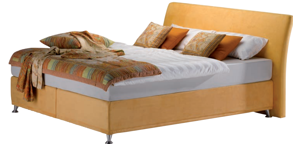
Abbildung: Box-Spring System: r///m - Foam Matress Füße: Apollo Kopfteil: Rom Höhe: 100 cm

Abbildung: Box-Spring mit Shirting System: r///m - Foam Matress Füße: Blocks Kopfteil: Oslo Höhe: 145 cm ohne Steppnähte