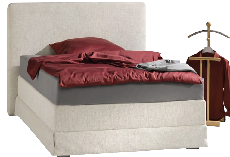
Abbildung: Box-Spring mit Shirting System: r///m - Foam Matress Füße: Blocks Kopfteil: Oslo Höhe: 145 cm ohne Steppnähte

Der Box-Spring III - Unterbau ist dem klassischen Box-Springbett nachempfunden, da er mit einer hochwertigen Tonnentaschenfederkern - Unterfederung ausgestattet wird. Durch die darauf liegende Federkernmatratzen entsteht eine Doppelfederung, welche das Körpergewicht hervorragend verteilt.